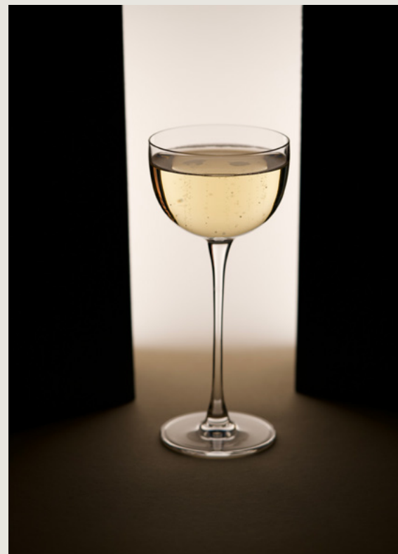
Das finale Ergebnis.