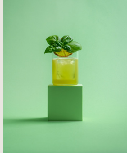
Negative Space kreiert Fokus und einen minimalistischen Look.

Wichtig: Es empfiehlt sich immer, aus verschiedenen Höhen und Winkeln zu fotografieren. Jedes Mal verändern sich die Perspektive und damit die Ästhetik des Bildes. Dabei gilt es, nicht zu vergessen stets zu kontrollieren, ob der Fokus noch sitzt.