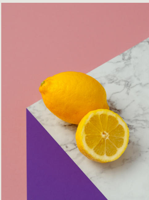
Drei Papierbögen, einer in Marmor-Look, kreieren einen dreidimensionalen Optik.