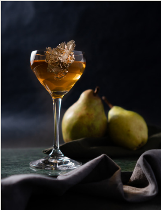
Vorder-, Mittel- und Hintergrund kreieren Tiefe.